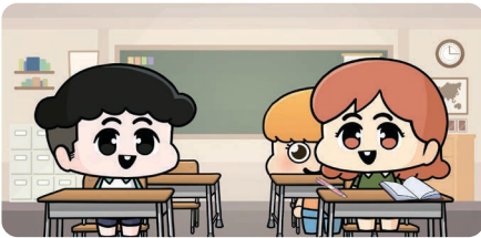
학교폭력 예방교육 동영상(초등용)

🔍 학교폭력 예방교육 동영상 을 통해 학교폭력이 무엇인지, 학교폭력을 경험했을 때 어떻게 행동해야 하는지를 학습할 수 있습니다.